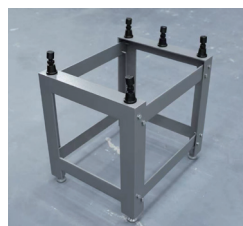
石定盤架台(組み立てタイプ、キャスター無し)